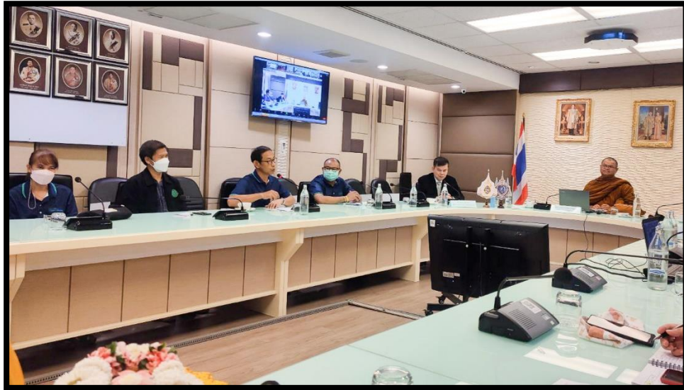
ผู้เข้าร่วมโครงการสัมมนาบรรยายให้ความรู้ เรื่อง การส่งเสริมคุณธรรม จริยธรรม ตามหลักธรรมคำสอนทางพระพุทธศาสนา กระทรวงเกษตรและสหกรณ์ ผ่านระบบออนไลน์ Zoom Meeting ณ ห้องประชุมกระทรวงเกษตรและสหกรณ์ (ห้อง ๑๒๓)