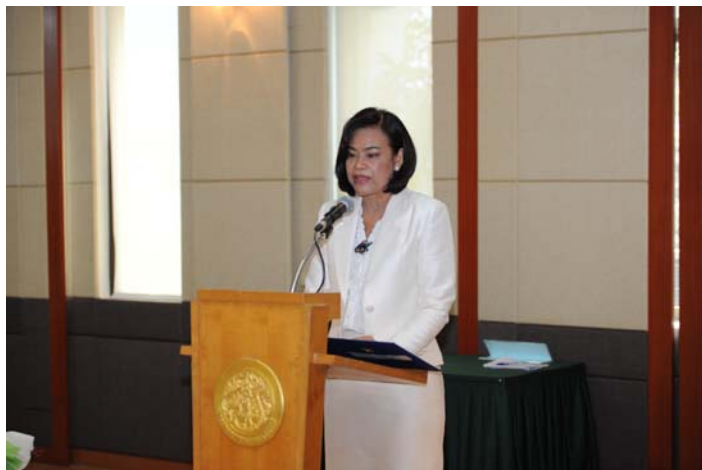
รองปลัดกระทรวงเกษตรและสหกรณ์ (นางบริสุทธิ์ เปรมประพันธ์) กล่าวรายงานเป็นมาในการจัดงาน “กระทรวงเกษตรและสหกรณ์ก้าวไกล ร่วมใจต่อต้านการทุจริต”