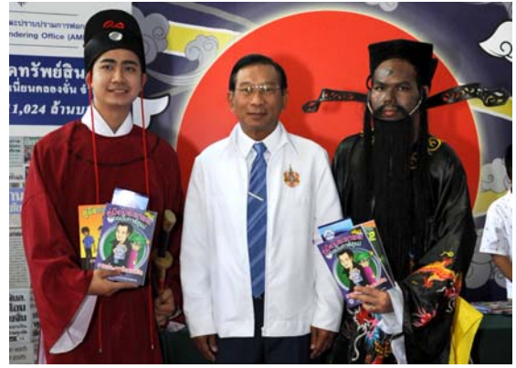
ภาพบรรยากาศภายในงาน