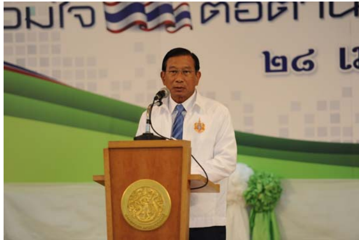
รัฐมนตรีว่าการกระทรวงเกษตรและสหกรณ์ (พลเอก ฉัตรชัย สาริกัลยะ) กล่าวเปิดงานและมอบนโยบายด้านการต่อต้านการทุจริต