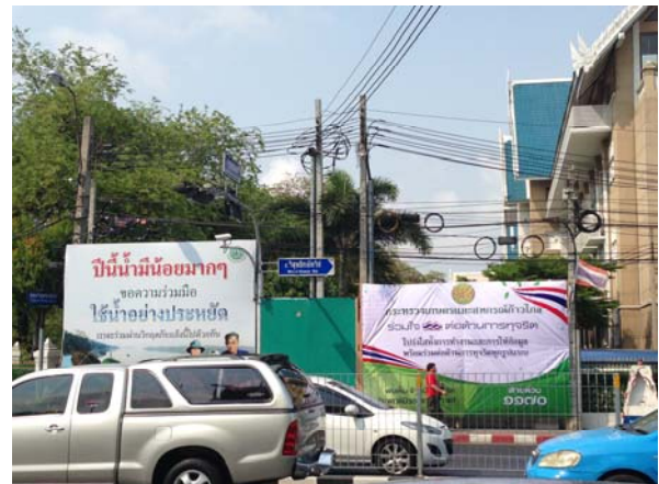
ป้ายคัดเอาท์รณรงค์ประชาสัมพันธ์บริเวณด้านถนนวิสุทธิกษัตริย์ และถนนราชดำเนินนอก