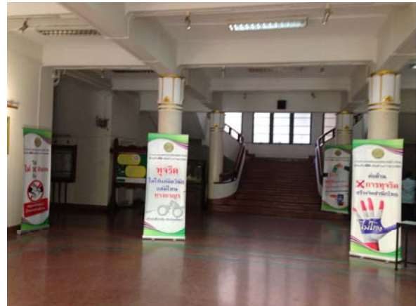
จัดกิจกรรมเขียนข้อความแสดงออกถึงความมุ่งมั่นในการต่อต้านการทุจริตร่วมกัน บริเวณอาคาร ๑ ชั้น ๑ โถงฝั่งกองกลาง ระหว่างวันที่ ๒๙ เมษายน - ๑๓ พฤษภาคม ๒๕๕๙