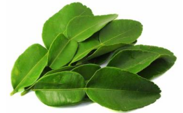
ใบมะกรูด