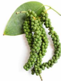
พริกไทยอ่อน