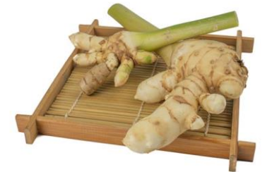
ขมิ้นขาว