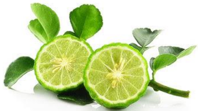
ลูกมะกรูด