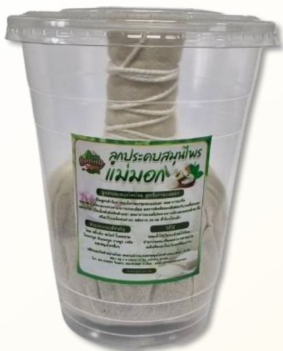
ลูกประคบ