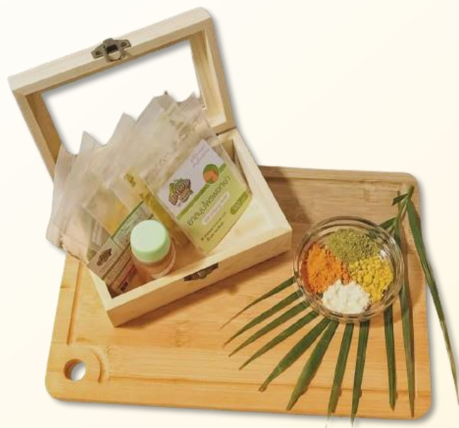
ยาพอกเข้า