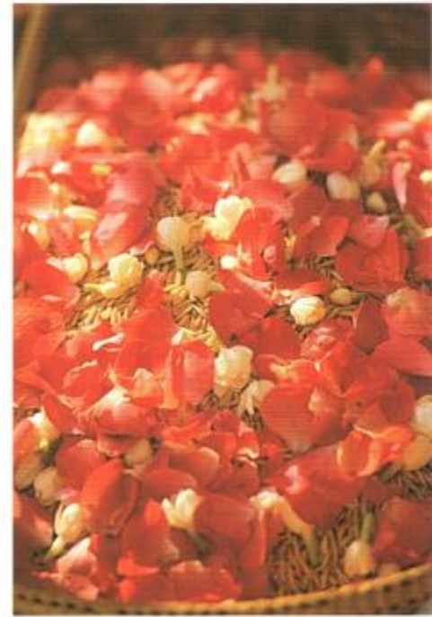
ข้าวมงคล

ในสมัยสุโขทัย พระเจ้าแผ่นดินเสด็จพระราชดำเนินไปทอดพระเนตรพิธีแรกนาด้วยพระองค์เอง ในสมัยอยุธยา พระเจ้าแผ่นดินไม่เสด็จฯ ไปด้วยพระองค์เอง แต่พระราชทานพระแสงอาญาสิทธิ์แก่พระยาแรกนา ถือเสมือนเป็นผู้แทนพระองค์ ต่อมาในสมัยรัตนโกสินทร์ พระเจ้าแผ่นดินเสด็จฯ ไปทอดพระเนตรบ้างเป็นครั้งคราว และระงับไปหลังการเปลี่ยนแปลงการปกครอง พ.ศ. ๒๔๗๕ แต่ได้กลับมารื้อฟื้นใหม่อีกครั้งหนึ่ง ในรัชสมัยพระเจ้าอยู่หัวองค์ปัจจุบัน เมื่อปี พ.ศ. ๒๕๐๓