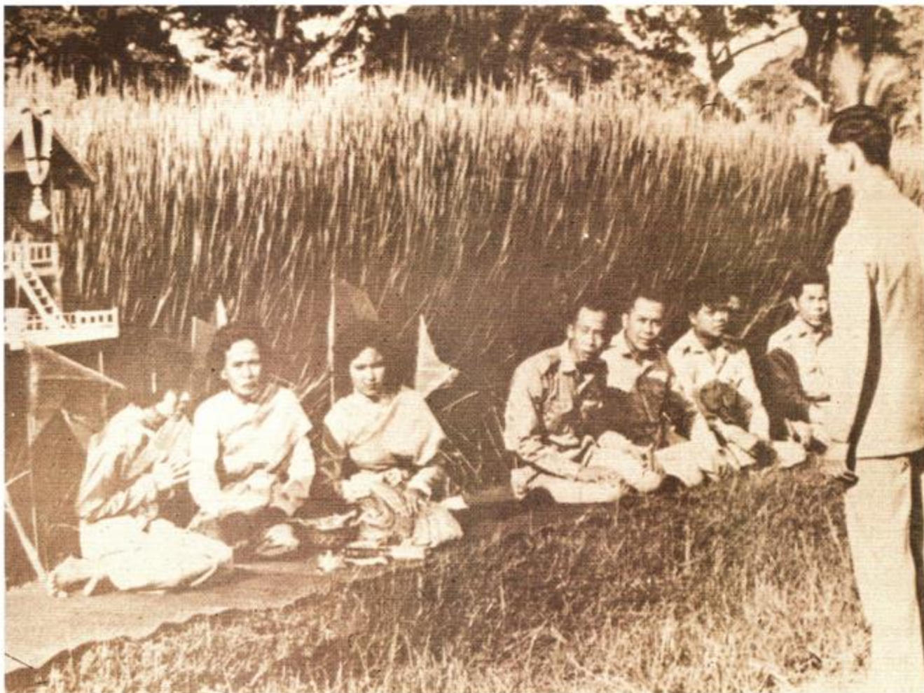
พิธีทำขวัญแม่โพสพ ณ แปลงนาทดลอง สวนจิตรลดา ๒๗ ตุลาคม ๒๕๐๔

ในปัจจุบันเมื่อความต้องการข้าวมีมากขึ้น มีการนำเทคโนโลยีสมัยใหม่ เข้ามาใช้มีบทบาทในการผลิต พิธีกรรมเหล่านี้ค่อยๆ ลดบทบาทลง จากการอ้อนวอน เพื่อขอฝนจากเทวดา เปลี่ยนเป็นการทำฝนเทียมหรือใช้เทคโนโลยี การชลประทาน จากการใช้แรงงานวัวควายเปลี่ยนมาเป็นใช้แรงงานเครื่องจักรกล จากการ อ้อนวอนขอความเมตตาจากเทวดาเพื่อความอุดมสมบูรณ์ เปลี่ยนเป็น การใส่ปุ๋ย ใช้ยาฆ่าแมลง ฯลฯ เทคโนโลยีทันสมัยเหล่านี้ได้เข้ามาแทนที่พิธีกรรม ดั้งเดิม จึงปรากฏว่าพิธีกรรมในการเพาะปลูกของคนไทยเป็นพิธีกรรมที่หมดไป เร็วที่สุดก่อนพิธีกรรมประเภทอื่นๆ