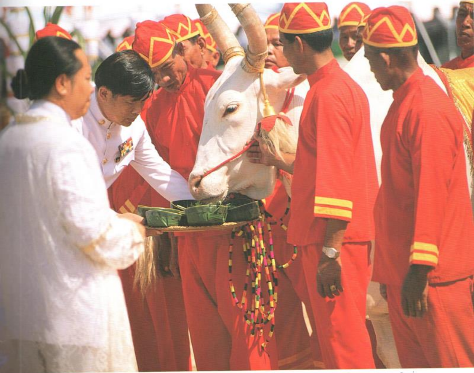
พระโคเสียงทาย