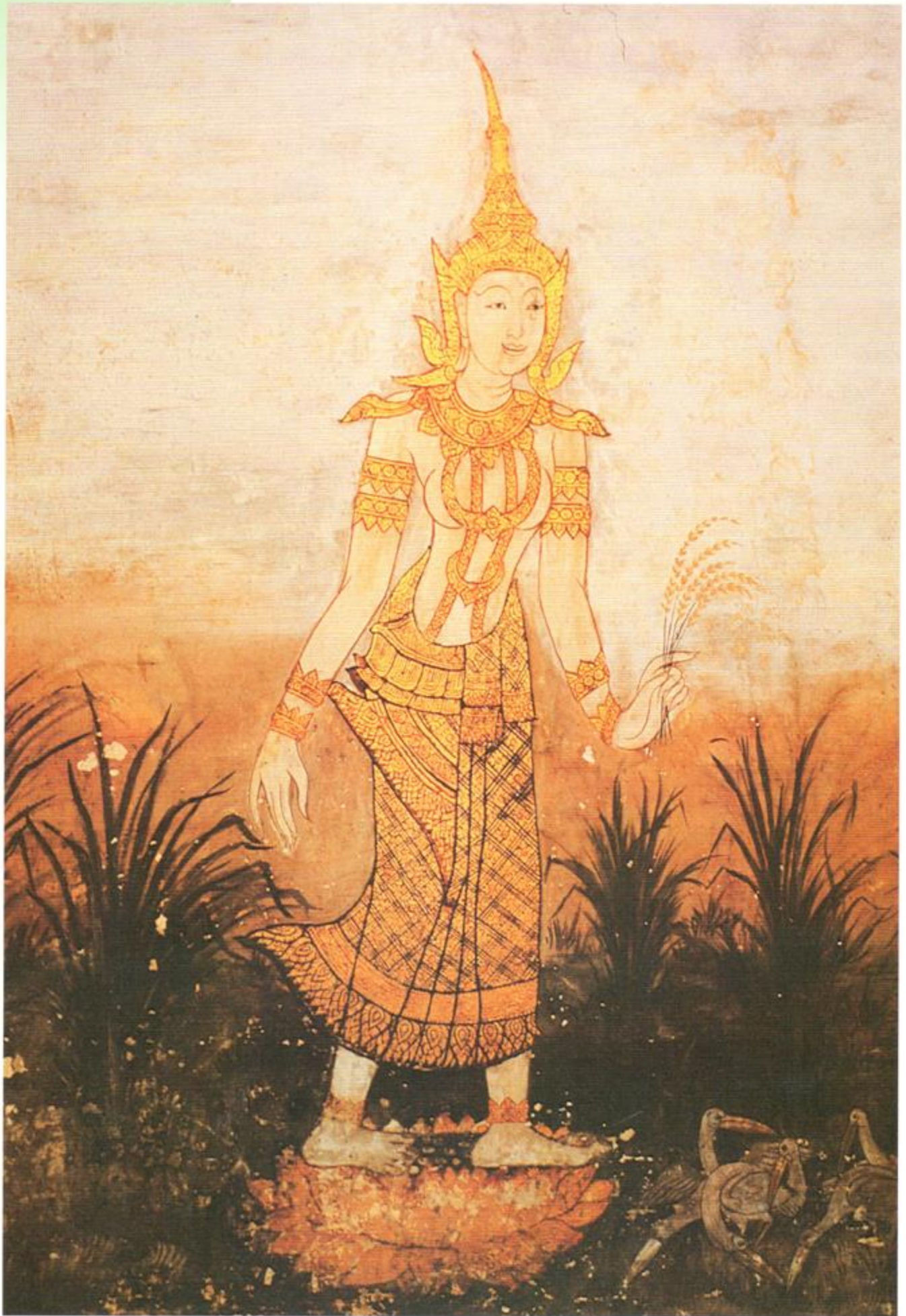
แม่โพสพ ณ พระที่นั่งไพศาลทักษิณ พระบรมมหาราชวัง