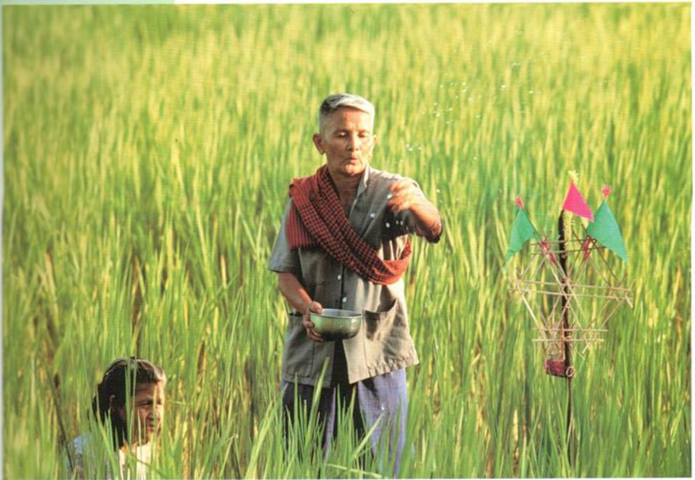
ทำขวัญข้าว

ในด้านความคิดความเชื่อของชุมชนในวัฒนธรรมข้าวแสดงออกในรูปของ พิธีกรรมเพื่อความอุดมสมบูรณ์ของพืชพันธุ์ธัญญาหาร เป็นการอัญวอนธรรมชาติ หรือเทพแห่งธรรมชาติ ให้อำนวยความอุดมสมบูรณ์แก่ผลผลิตที่ได้ลงแรงผลิตไป ซึ่งรวมความถึงความอยู่เย็นเป็นสุขของครอบครัวและความมั่นคงของชุมชน พิธีกรรมที่เกี่ยวกับข้าวและการทำนา หรือรวมเรียกว่า พิธีกรรมที่เกี่ยวข้องกับการเพาะปลูก จึงเป็นพิธีกรรมสำคัญของชุมชนวัฒนธรรมข้าว เช่น สังคมไทย