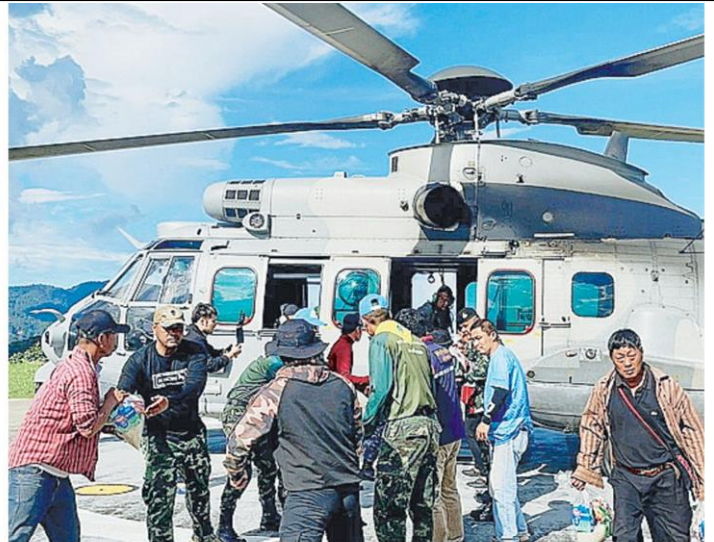
เร่งช่วย ทหาร และ จนท.ปภ.เชียงราย ช่วยกันขนเสบียงอาหารขึ้น ฮ.ไปแจกแก่ชาวบ้าน 12 หมู่บ้าน ใน อ.แม่ฟ้าหลวง จ.เชียงราย ที่ถูกน้ำท่วมและถูกตัดขาดจากภายนอก บางบ้านขาดแคลนอาหาร.