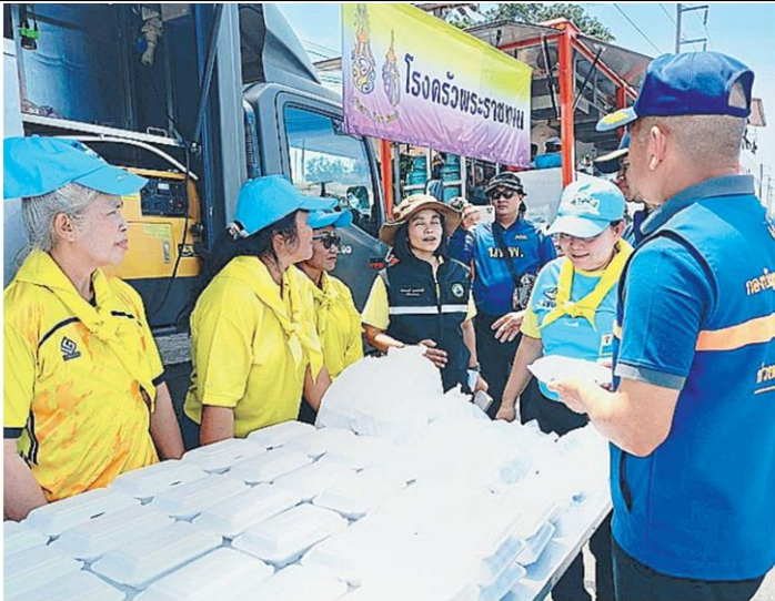
พระราชทาน จิตอาสาพระราชทานเปิด โรงครัวพระราชทานปรุงอาหารแจกจ่ายแก่ผู้ประสบภัย และผู้ที่ไปช่วยเหลือประชาชนในอำเภอต่างๆของ จ.หนองคาย ตลอดทั้งวัน.