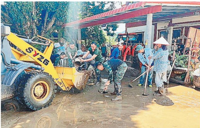
ระดมฟื้นฟู ทหารนำรถแทรกเตอร์และอุปกรณ์เข้าไปช่วยทำความสะอาดและฟื้นฟูสภาพบ้านที่ถูกน้ำท่วมให้ชาวบ้านในพื้นที่ อ.แม่สาย จ.เชียงราย พร้อมทั้งช่วยขนย้ายสิ่งของด้วย.