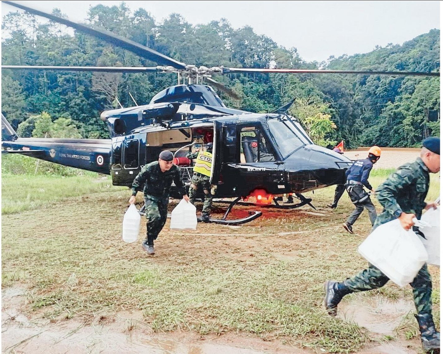
ส่งถึงที่ หน่วยเฉพาะกิจทัพเจ้าตาก กองกำลังผาเมือง นำเฮลิคอปเตอร์ขนส่งถังซีพีพร้อมอาหารและเครื่องอุปโภคบริโภค ไปลงที่อ่างเก็บน้ำปึง จ.แม่ฮ่องสอน แม่ฟ้าหลวง จ.เชียงราย และขนไปส่งให้ประชาชนที่ได้รับผลกระทบจากดินโคลนถล่มทับเส้นทางเข้าออก ถูกตัดขาดจากภายนอก 12 หมู่บ้าน และขาดแคลนอาหาร.