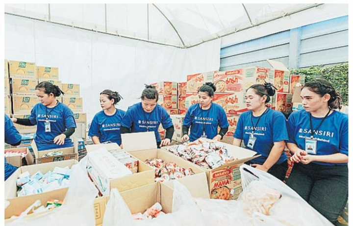
ไม่ทิ้งกัน จิตอาสา บริษัท แสนสิริ จำกัด (มหาชน) ลงพื้นที่จัดตั้งศูนย์ช่วยเหลือผู้ประสบภัยจ.เชียงราย และ จ.เชียงใหม่ แจกสิ่งของช่วยเหลือผู้ประสบภัย และร่วมทำความสะอาดในพื้นที่หลังจากน้ำลด.