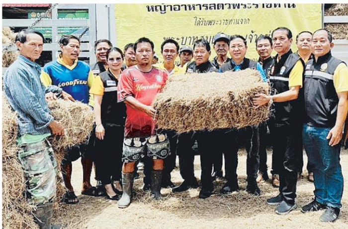
ดูแลสัตว์ ศ.ดร.นฤมล ภิญโญสินวัฒน์ รวบรวมเกษตรกรและสหกรณ์ ส่งการให้ น.สพ.สมชวน รัตนมังคลานนท์ อธิบดีกรมปศุสัตว์มอบหญ้าพระราชทานอาหารสัตว์และยา ส่งไปแจกเจ้าของสัตว์เลี้ยงที่ถูกน้ำท่วมภาคเหนือ-อีสาน.