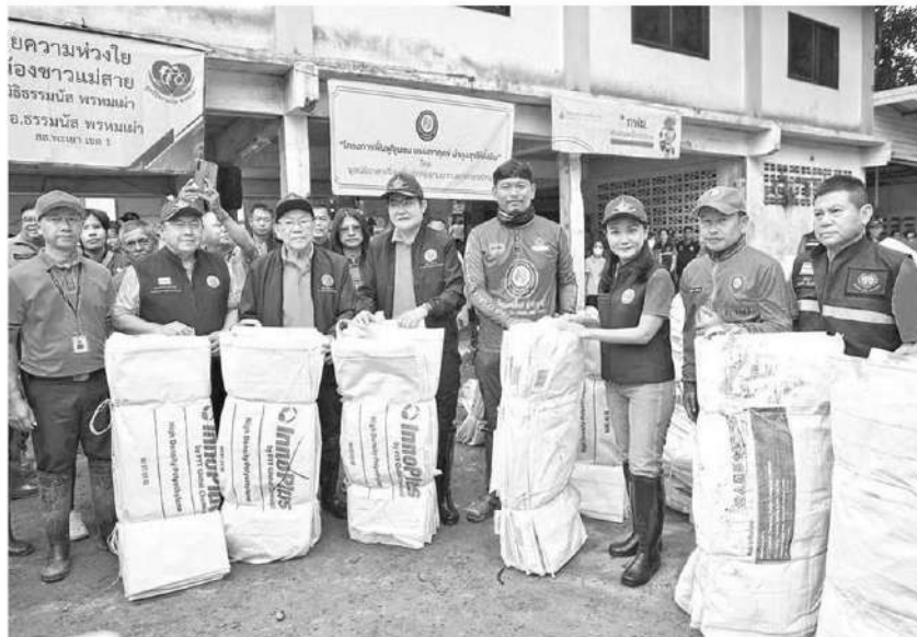
ลงพื้นที่ - น.สนอุดม ภิญโญสินวัฒน์ รัฐมนตรีว่าการกระทรวงเกษตรและสหกรณ์ นายอิทธิ ศิริลัทธยากร และนายอัศรา พรหมเผ่า รัฐมนตรีช่วยว่าการกระทรวงเกษตรและสหกรณ์ ลงพื้นที่ติดตามสถานการณ์อุทกภัยในพื้นที่ จ.เชียงราย เมื่อวันที่ 21 กันยายน