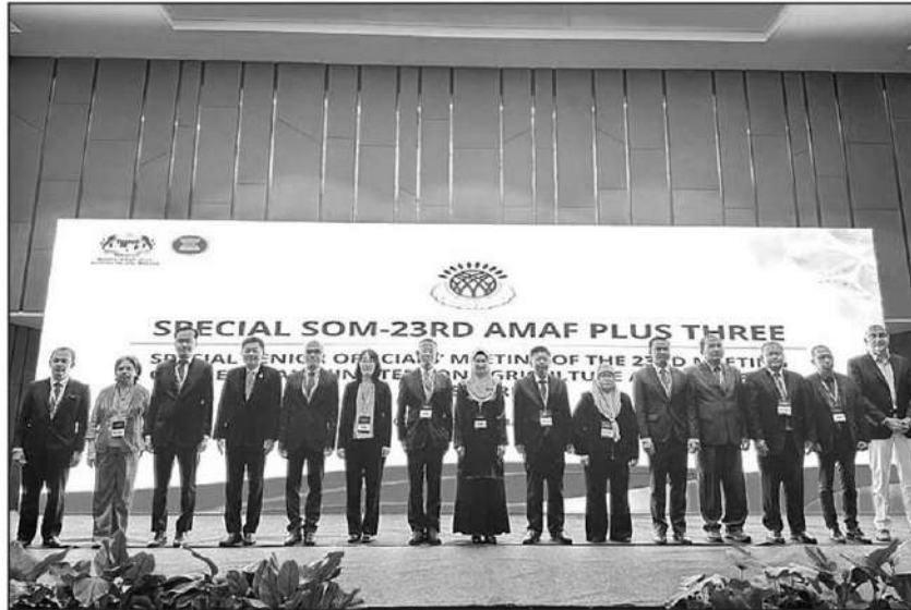
ร่วมประชุม : นายถาวร ทันใจ ผู้ตรวจราชการกระทรวงเกษตรและสหกรณ์ หัวหน้าคณะผู้แทนไทย ร่วมประชุมระดับเจ้าหน้าที่อาวุโสของการประชุมรัฐมนตรีอาเซียนด้านการเกษตรและป่าไม้ ครั้งที่ 23 สมัยพิเศษ รัับทราบความก้าวหน้าโครงการความร่วมมือฯ และผลการดำเนินงานด้านความมั่นคงทางอาหาร