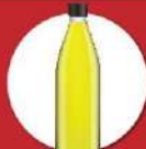
น้ำมันปลา