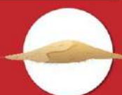
อาหารสัตว์

ข้อเสนอของ ก.แรงงานสหรัฐ (DOL) ต่อรัฐบาลไทย