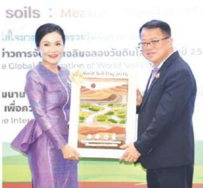
ศ.ดร.นฤมล ภิญโญสินวัฒน์ รัฐมนตรี

ว่าการกระทรวงเกษตรและสหกรณ์ เป็นประธานการแถลงข่าวการจัดการงานเฉลิมฉลองวันดินโลก ประจำปี 2567 (The Global