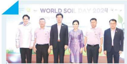
ก้าวสู่ทศวรรษที่ 2 ของวันดินโลก 5 ธันวาคม 2567 'ใส่ใจมาตรฐาน ตรวจวัดจัดการ ดินที่ยั่งยืน' >2