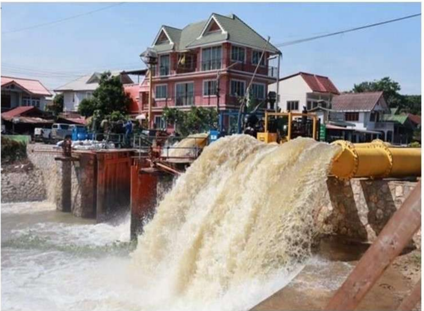
พระนครศรีอยุธยา - รัฐมนตรีช่วยว่าการกระทรวงเกษตรฯ Kick Off โครงการเพิ่มประสิทธิภาพการบริหารจัดการน้ำในพื้นที่ลุ่มต่ำ

เผยแพร่: 20 พ.ย. 2567 20:25 ปรับปรุง: 20 พ.ย. 2567 20:25 โดย: ผู้จัดการออนไลน์