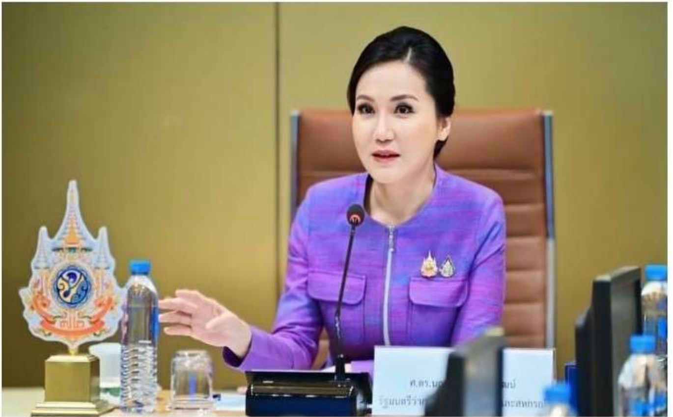
📅 20 พ.ย. 2567 14:48 น.

ข่าว วิดีโอ หนังสือพิมพ์ ไทยรัฐทีวี ไลฟ์สไตล์ กีฬาบันเทิง ดวง หอว นิชาย ซือปปี