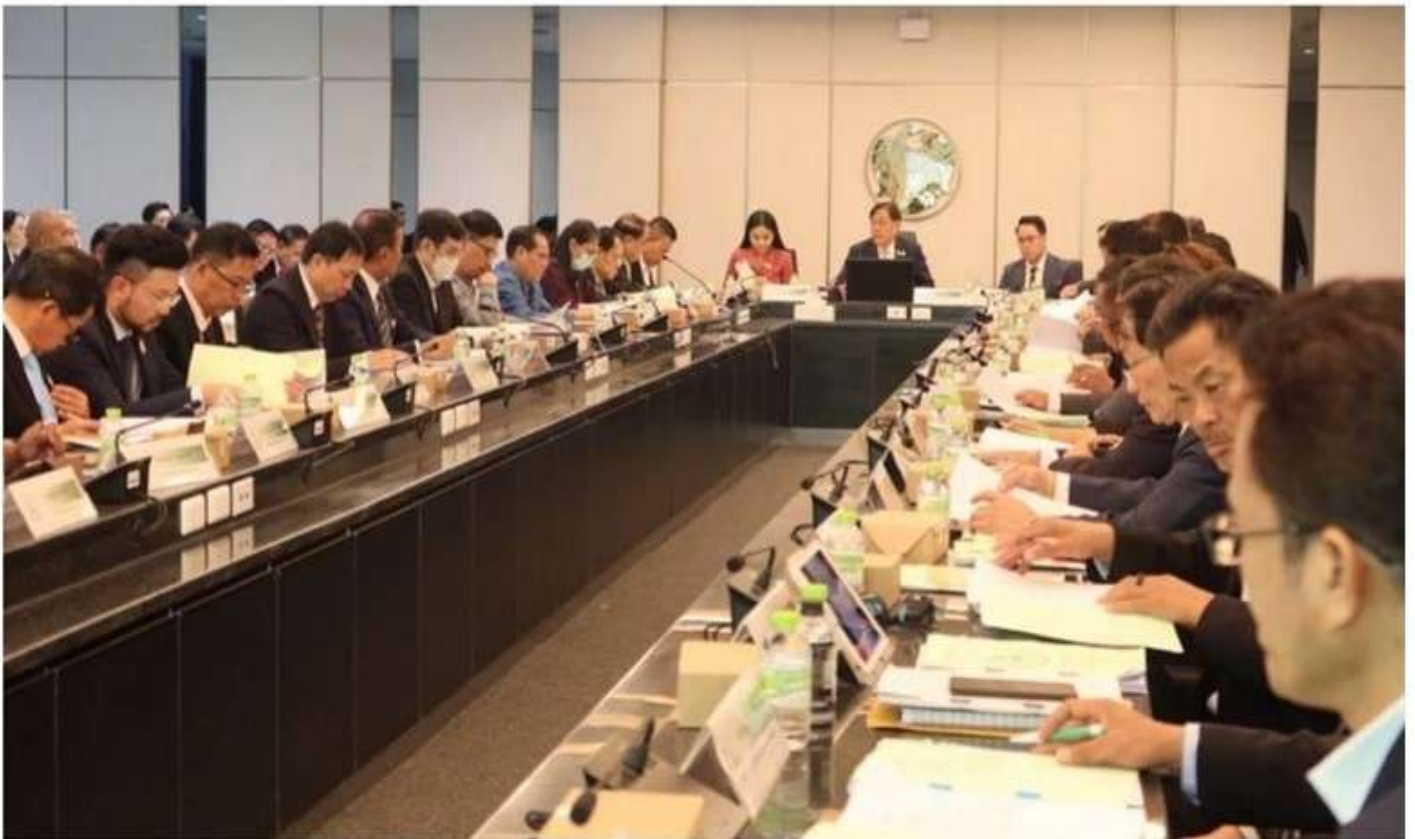
3 พ.ย. 2567 16:48 น.

ข่าว วิดีโอ หนังสือพิมพ์ ไทยรัฐทีวี โลฟสดัลส์ กีฬา บันเทิง ดวง หวย นิยาย ซือปิ้ง