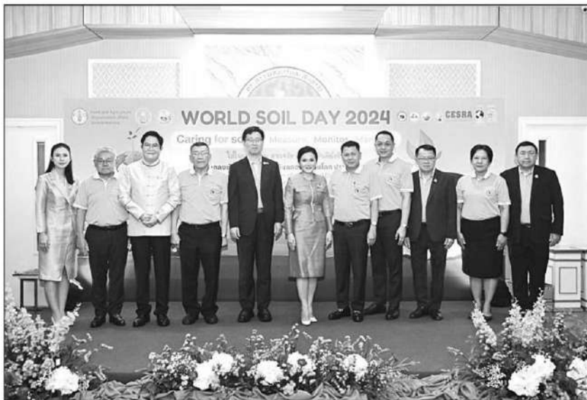
จัดงาน : ศ.ดร.นฤมล ภิญโญสินวัฒน์ รว.เกษตรและสหกรณ์ พร้อมคณะ และผู้เกี่ยวข้อง ร่วมงานฉลองวันดินโลก ประจำปี 2567 (The Global Celebration of World Soil Day 2024) หัวข้อ “Caring for soils: measure, monitor, manage” ใส่ใจมาตรฐาน ตรวจวัดจัดการ ดินดียั่งยืน วันที่ 5 ธันวาคม 2567

นอกจากนี้ ยังจัดประชุมนานาชาติว่าด้วยการจัดการทรัพยากรดินและน้ำ เพื่อความมั่นคงทางอาหารอย่างยั่งยืน (The International Soil and Water Forum 2024) ที่โรงแรมอนันตรา สยาม มุ่งมั่นจัดการทรัพยากรดินและน้ำ อย่างบูรณาการ ซึ่งเป็นรากฐานของการพลิกโฉมระบบการเกษตรและอาหาร