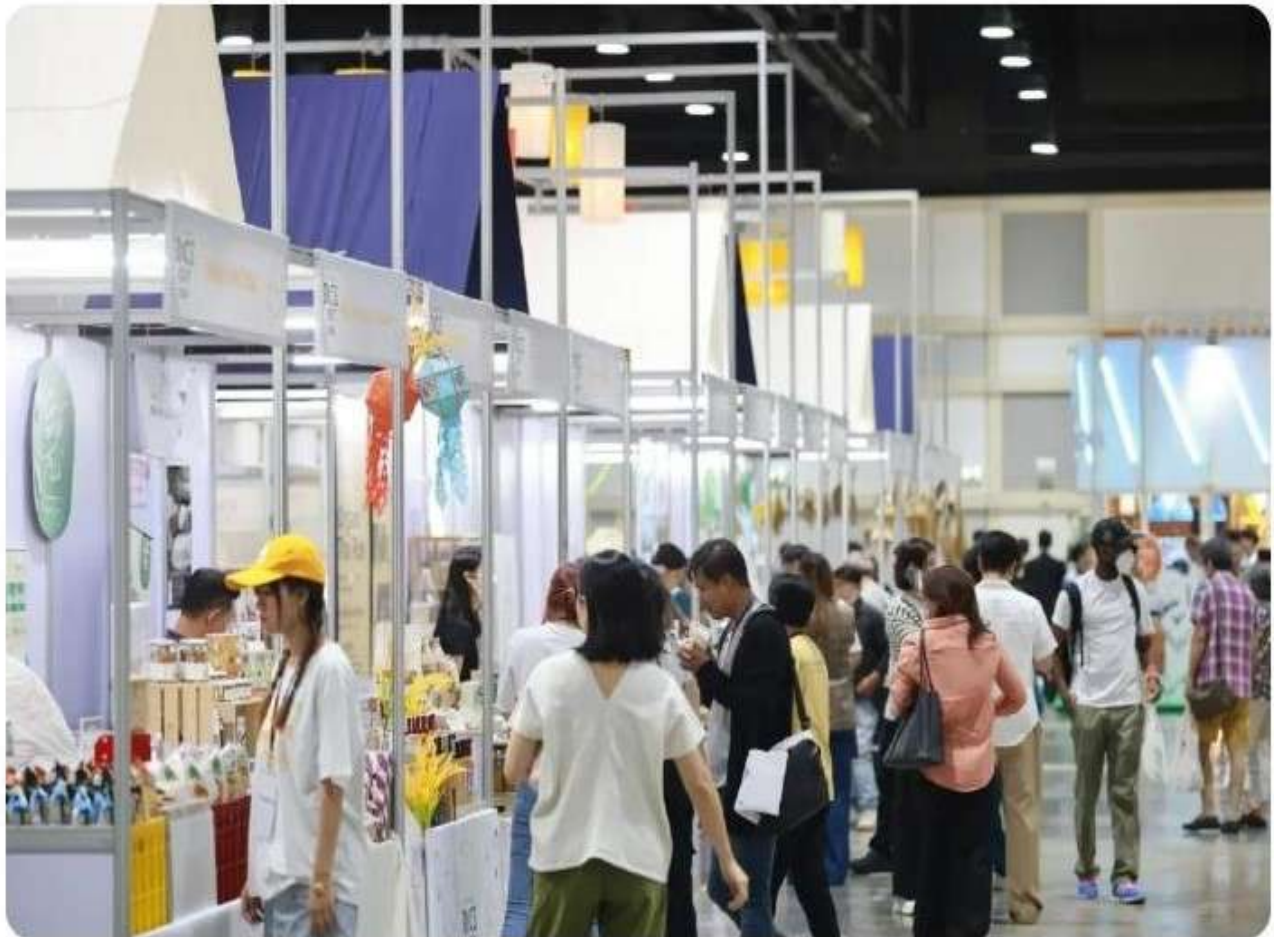
บรรยากาศภายในงานข้าว

เริ่มตั้งแต่ ‘ข้าวสรรพสี (Rainbow Rice)’ ข้าวที่ปลูกเพื่อกินใบ แคมเปญ ‘ข้าวหมูแดง’ ชวนซื้อข้าวอินทรีย์ เพื่อสนับสนุนผลผลิตล่องหนจากเกษตรกรผู้ประสพภัยน้ำท่วมเชียงราย การสร้างเกษตรกรต้นแบบผ่านรางวัลเกษตรกรไทยแห่งปี 2567 (Thailand Farmer of the Year) และ The Next Farmer ที่ชี้ให้เห็นบทบาทของเกษตรกรต้นแบบ และเวทีสัมมนาข้าวไทย (Rice Talk) 4 หัวข้อตลอด 4 วัน โดยคนในวงการข้าว เพื่อให้ผู้ที่สนใจมองเห็นความเป็นไปได้และโอกาสในการต่อยอดธุรกิจจากข้าวไทย