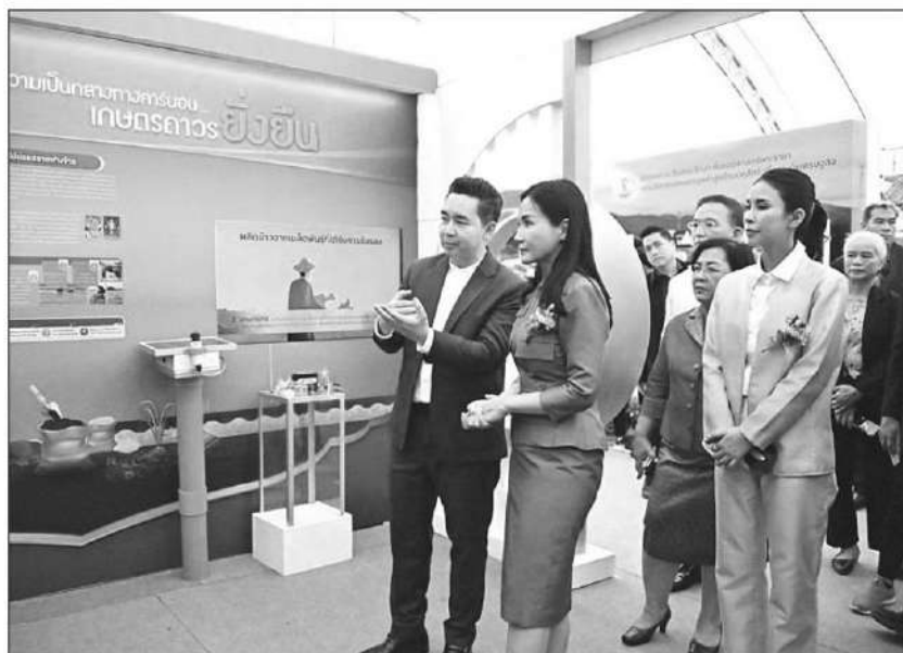
ร่วมงาน : ศ.ดร.นฤมล ภิญโญสินวัฒน์ รมว.เกษตรและสหกรณ์ ร่วมงานวันเกษตรแห่งชาติ ภายใต้แนวคิด “สืบสาน รักษา และต่อยอดศาสตร์พระราชา สู่เกษตรทันสมัย ความมั่นคงทางอาหารและความเป็นกลางทางคาร์บอน เพื่อการพัฒนาที่ยั่งยืน” ที่ไร่แม่เหิยะ ศูนย์วิจัย บูรณาการ สาธิตฯ มหาวิทยาลัยเชียงใหม่

สำหรับกิจกรรมภายในงานวันเกษตรแห่งชาติ ประจำปี 2567 แบ่งออกเป็น 7 โซน ได้แก่ 1.Agri knowledge and innovation ความรู้และนวัตกรรมด้านการเกษตร 2.Agri innovations for sustainable and king philosophy นวัตกรรมเกษตรสู่ความยั่งยืนและศาสตร์พระราชา 3.ชม ชิม ช้อป ใน Green and clean market 4.greenovation wonderland มหัศจรรย์พรรณพฤกษา 5.Food and agri innovations นวัตกรรมอาหารและการเกษตร 6.Happy farmland ดินแดนแห่งฟาร์มสุข และ 7.Amazing agro-tourism กิน บิน ฟิน มหัศจรรย์ท่องเที่ยวเชิงเกษตร