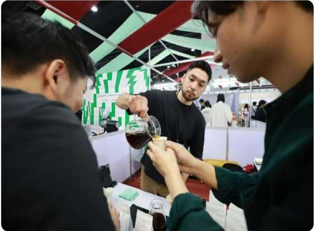
Thailand Rice Fest 2024 และ Thailand Coffee Fest 'Year End' 2024

โดย Thailand Rice Fest 2024 แสดงถึงศักยภาพของข้าวไทยที่หลากหลาย ไม่จำกัดเพียงการบริโภคในรูปแบบเดิมอีกต่อไป แต่มีการคิดค้น สร้างนวัตกรรม เชื่อมโยงชุมชนและผู้บริโภค ภายใต้ความตั้งใจที่จะร่วมกันพัฒนาข้าวไทยให้ก้าวไกลไปอีกขั้น