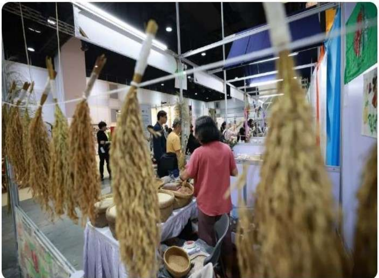
บรรยากาศภายในงานข้าว

ภายในงานยังชวนเลือกซื้อข้าวและสินค้าเกษตรที่ดีต่อเราและโลก เลือกชิมอาหารจากเชฟและชาวบ้านที่แสดงถึงความหลากหลายและคุณค่าของข้าวไทย Thailand Rice Fest 2024 จึงเป็นโอกาสสำคัญที่จะแสดงศักยภาพของข้าวไทยที่อยู่ในชีวิตประจำวัน และพร้อมพัฒนาไปสู่อนาคตอย่างยั่งยืน