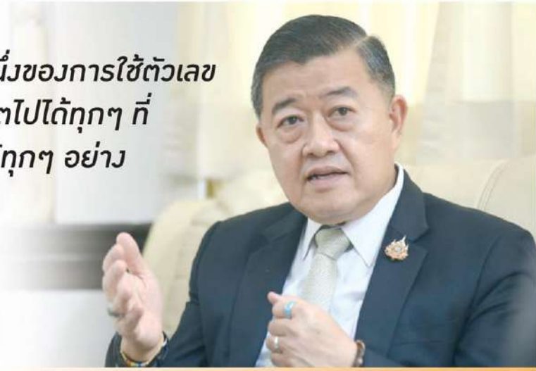
ดร.วินัยโรจน์ ทรัพย์สงสุข อธิบดีกรมตรวจบัญชีสหกรณ์

และปราบปรามการฟอกเงิน (ปปง.) และกรมส่งเสริมสหกรณ์ได้ทำบันทึกความร่วมมือ (MOU) ในการป้องกันและปราบปรามการฟอกเงินผ่านสหกรณ์