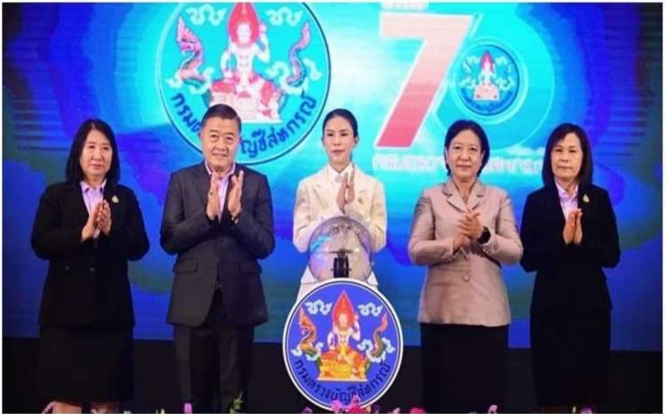
11 มี.ค. 2568 16:40 น.

หนังสือพิมพ์ ไทยรัฐทีวี โลฟสโด้ส กีฬา บันเทิง ดวง หอย นิยาย ซือปป์ MONEY