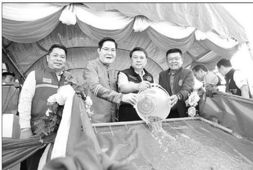
ปล่อยสัตว์น้ำ : นายอัครา พรหมเผ่า รมช.เกษตรและสหกรณ์ ร่วมปล่อยพันธุ์สัตว์น้ำโครงการบริหารจัดการทรัพยากรประมง เพื่อเพิ่มผลผลิตสัตว์น้ำในแหล่งน้ำชุมชน เพิ่มรายได้ ลดค่าครองชีพของประชาชน ที่บ้านใหม่ดอนชัย จ.เชียงใหม่ และขยายผลสู่ชุมชนอื่น รวมปล่อยพันธุ์สัตว์น้ำจืดเศรษฐกิจ ทั้งสิ้น 116.4 ล้านตัว

ด้านนายบัญชา สุขแก้ว อธิบดีกรมประมง กล่าวว่า มุ่งหวังว่าโครงการดังกล่าวจะช่วยแก้ปัญหาฝุ่น PM2.5 ได้อย่างจริงจัง และช่วยส่งเสริมเพิ่มรายได้ลดค่าครองชีพให้กับเกษตรกร ตลอดจนเพิ่มจำนวนประชากรสัตว์น้ำประจำถิ่นในธรรมชาติและสัตว์น้ำที่ไม่สามารถหาพื้นที่เหมาะสมตามธรรมชาติในช่วงฤดูผสมพันธุ์และวางไข่ได้ ช่วยคืนความอุดมสมบูรณ์ให้ชุมชนและสร้างแหล่งอาหารโปรตีน