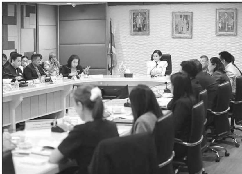
เปิดตลาด : ศ.ดร.นฤมล ภิญโญสินวัฒน์ รว.เกษตรและสหกรณ์ ประชุมคณะกรรมการนโยบายพัฒนาโคเนื้อ-กระบือ และผลิตภัณฑ์แห่งชาติ (Beef Board) โดยทราบว่า สามารถเปิดตลาดส่งออกเนื้อโคไปยังประเทศมาเลเซียได้แล้ว ตามข้อกำหนดที่ตกลง และเตรียมเปิดตลาดสินค้าปศุสัตว์ไปยังประเทศจีน

“กระทรวงเกษตรฯ มีสินค้าเกษตรส่งออกที่สำคัญ โดยเฉพาะยางพารา ที่ไทยส่งออกเป็นอันดับหนึ่งของโลก อย่างไรก็ตาม โคเนื้อและ