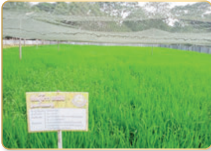
แปลงข้าว พันธุ์กข๙๕