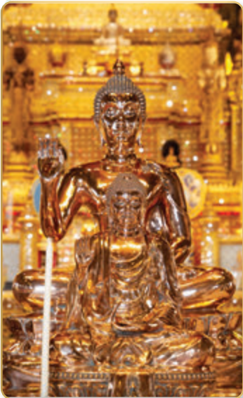
“พระคันธารราษฎร์”

ข้อ ๔ อ่างพระราชหฤทัยของพระเจ้าแผ่นดิน ซึ่งทรงพระเมตตากรุณาแก่ประชาราษฎร ตั้งพระราชหฤทัยจะบำรุงให้อยู่เย็นเป็นสุขทั่วหน้าเป็นความสัตย์จริง ด้วยอำนาจความสัตย์นี้ขอให้ข้าวกล้า และพืชผลงอกงามบริบูรณ์ทั่วราชอาณาจักร