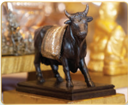
รูปปั้นโคอุสุภราช

ตามคติของศาสนาพราหมณ์ ตามตำนานกล่าวว่าโคอุสุภราช (เผือกผู้) มีนามว่า พระนนทิ ถือกันว่าเป็นเทพเจ้าแห่งสัตว์จตุบาท พระนนทิจะแปลงรูป