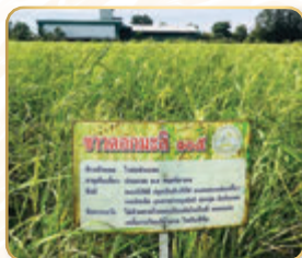
แปลงข้าว พันธุ์ขาวดอกมะลิ ๑๐๕