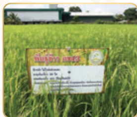
แปลงข้าว พันธุ์กข๔๓