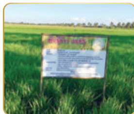
แปลงข้าว พันธุ์กข๘๕