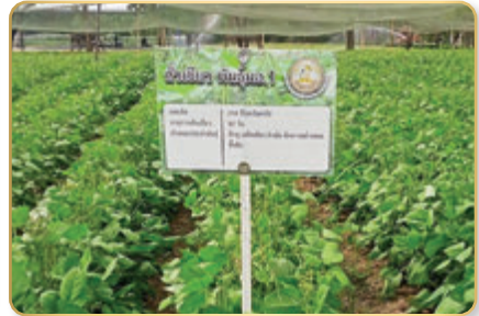
แปลงถั่วเขียว มอ.๑