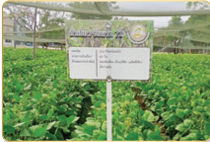
แปลงถั่วเขียว ชัยนาท ๗๒

แปลงระบบการปลูกพืชหมุนเวียนตระกูลถั่วและพืชไร่ใช้น้ำน้อย ฤดูแล้งปี ๒๕๖๖