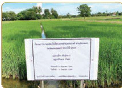
แปลงข้าว พันธุ์กข๖