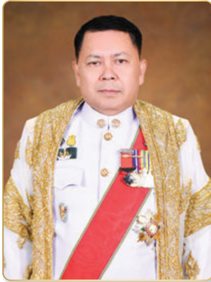
นายประยูร อินสกุล ปลัดกระทรวงเกษตรและสหกรณ์