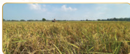
แปลงข้าว พันธุ์กข๘๗