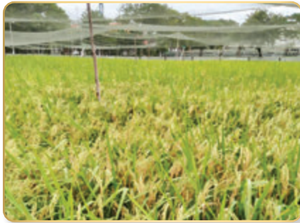
แปลงข้าว พันธุ์กข๘๗