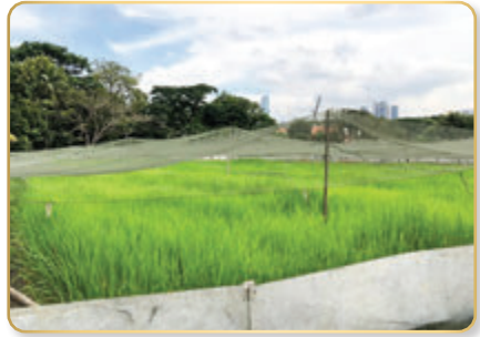
แปลงข้าว พันธุ์กข๖