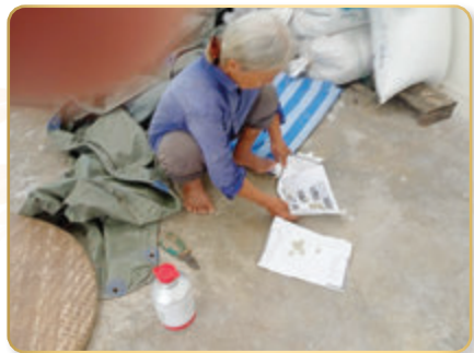
การรมสารอลูมิเนียม ฟอสไฟด์ เพื่อเก็บรักษาเมล็ดพันธุ์ข้าว ไม่ให้มอดเข้าทำลาย