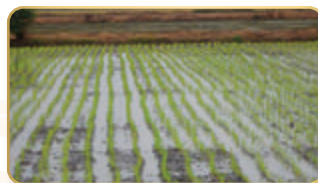
ปลูกข้าวโดยใช้รถปักดำ