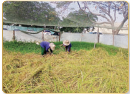
เกี่ยวข้าวพันธุ์ขาวดอกมะลิ ๑๐๕