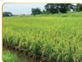
แปลงข้าว พันธุ์สันป่าตอง ๑