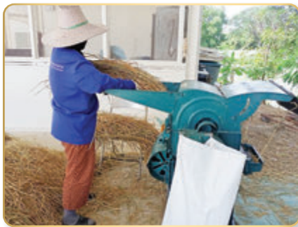
การนวดข้าวโดยการใช้ต้อนวดข้าว เครื่องยนต์ดีเซล