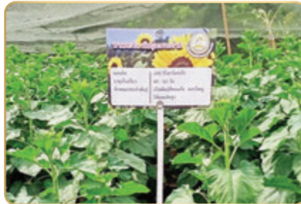
แปลงทานตะวันลูกผสมพันธุ์อะควอรา ๖