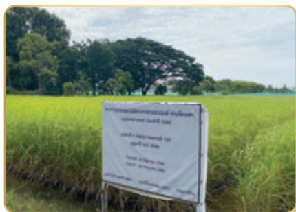
แปลงข้าว พันธุ์ขาวดอกมะลิ ๑๐๕

แปลงปลูกข้าวนาสวนพันธุ์หลัก ฤดูนาปี ๒๕๖๖ ณ แปลงขยายผลศูนย์วิจัยข้าวนครราชสีมา