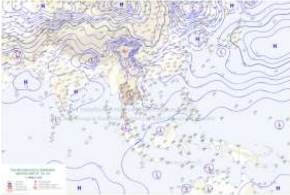
แผนที่อากาศผิวพื้น วันที่ 12 มีนาคม 2568 เวลา 07:00

ขอให้ชาวเรือในบริเวณดังกล่าวเดินเรือด้วยความระมัดระวังและหลีกเลี่ยงการเดินเรือในบริเวณที่มีฝนฟ้าคะนองไว้ด้วย