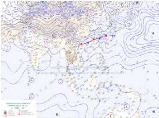
แผนที่อากาศผิวพื้น วันที่ 13 มีนาคม 2568 เวลา 01:00

สำหรับลมตะวันออกเฉียงใต้พัดปกคลุมอ่าวไทย ภาคใต้ และทะเลอันดามัน ทำให้ภาคใต้ยังคงมีฝนฟ้าคะนองเกิดขึ้นได้ ส่วนบริเวณอ่าวไทยมีคลื่นสูงประมาณ 1 เมตร บริเวณที่มีฝนฟ้าคะนองคลื่นสูงมากกว่า 2 เมตร ขอให้ชาวเรือบริเวณอ่าวไทยและทะเลอันดามันหลีกเลี่ยงการเดินเรือในบริเวณที่มีฝนฟ้าคะนองไว้ด้วย