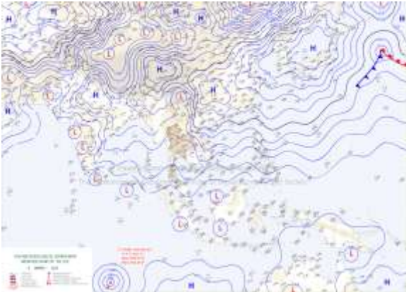
แผนที่อากาศผิวพื้น วันที่ 10 มีนาคม 2568 เวลา 07:00

ประเทศไทยตอนบนอุณหภูมิจะสูงขึ้น กับมีอากาศร้อนในตอนกลางวัน และมีฝนเล็กน้อยบางแห่ง ขอให้ประชาชนในบริเวณประเทศไทยดูแลรักษาสุขภาพเนื่องจากสภาพอากาศที่เปลี่ยนแปลง เนื่องจากบริเวณความกดอากาศสูงหรือมวลอากาศเย็นกำลังปานกลางที่ปกคลุมภาคตะวันออกเฉียงเหนือ และทะเลจีนใต้มีกำลังอ่อนลง ส่งผลทำให้ลมตะวันออกเฉียงใต้ที่พัดนำความชื้นจากทะเลจีนใต้และอ่าวไทย เข้ามาปกคลุมประเทศไทยตอนบนมีกำลังอ่อน