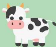
พันธุ์สัตว์