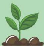
พันธุ์พืช