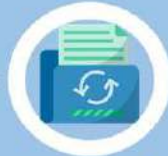
• ส่งสำเนาเอกสารชี้ชวน • ระบุการแก้ไขเปลี่ยนแปลง