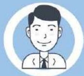
ผู้ประกอบการ ทางการเกษตร

คำตอบ : ให้ผู้ประกอบการธุรกิจทางการเกษตรนำเสนอเอกสารชี้ชวน สำนักงานปลัดกระทรวงเกษตรและสหกรณ์เพียง 1 ฉบับ หากมีการแก้ไข เปลี่ยนแปลงข้อสัญญาให้แตกต่างไปจากรายละเอียดในเอกสารสำหรับ การชี้ชวนที่ยื่นไว้แล้ว ให้คู่สัญญาระบุการแก้ไขเปลี่ยนแปลง