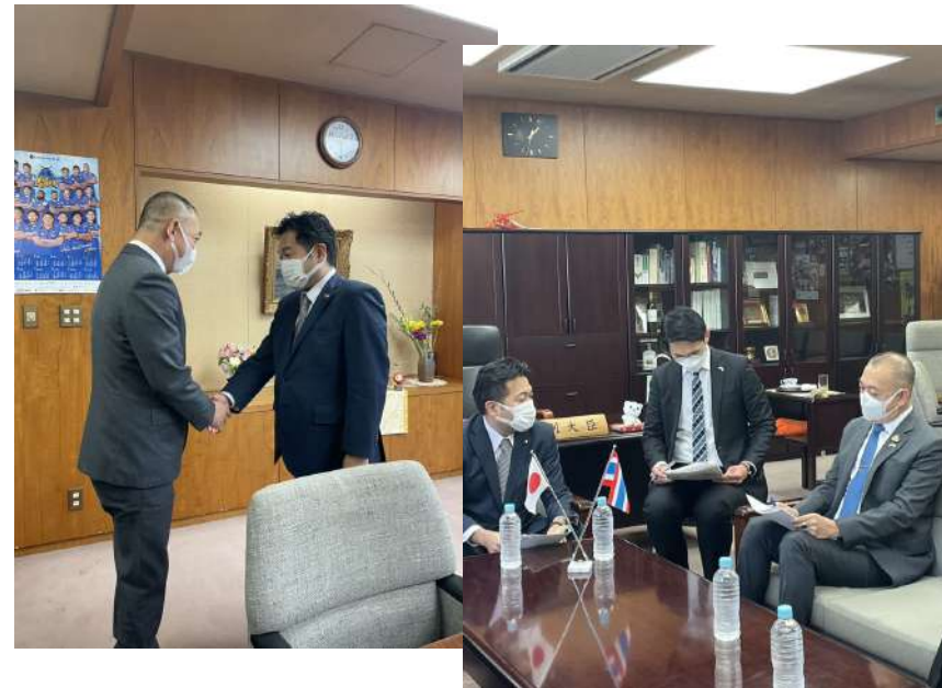
การหารือระหว่าง ดร.เฉลิมชัย ศรีอ่อน รมว.กษ. กับนายอัสลีชี โนนากะ รมช. กระทรวงเกษตร ป่าไม้ และประมงญี่ปุ่น

“การหารือร่วมกับญี่ปุ่นในครั้งนี้ นับเป็นโอกาสดีของทั้ง 2 ประเทศ ที่ได้ต่อยอดแนวทางความร่วมมือด้านการเกษตรร่วมกันในเชิงลึกยิ่งขึ้น และยังเป็น การส่งเสริมขยายความเชื่อมโยงในระดับภูมิภาคให้ยั่งยืน โดยใน ส่วนของประเด็นที่ญี่ปุ่นหรือประเทศไทยนั้น เราพร้อมให้ความร่วมมือตามแผน MEADRI ที่เสนอทั้งในระดับทวิภาคีและพหุภาคีอย่างเต็มที่ เนื่องจากมีความสอดคล้องกับนโยบายของกระทรวงเกษตรฯ และ BCG ของประเทศไทย รวมถึงประเทศไทยยังเห็นด้วยในการออกถ้อยแถลง ร่วมเกี่ยวกับระบบการผลิตอาหารและการเกษตรยั่งยืน ร่วมกับอีก 7 ประเทศ ตามข้อเสนอของ MAFF ที่เสนอต่อที่ประชุม UN Food Systems Pre-Summit เมื่อเดือนกรกฎาคม 2564 ณ กรุงโรม ประเทศอิตาลี” ดร.เฉลิมชัย กล่าว