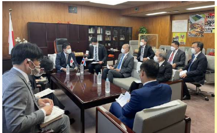
การหารือระหว่าง ดร.เฉลิมชัย ศรีอ่อน รมว.กษ. กับนายอัทสึชิ โนโมกะ รมช. กระทรวงเกษตร ป่าไม้ และประมงญี่ปุ่น

ณ กรุงเทพฯ และเป็นโอกาสอันดีที่จะหารือและรับฟัง รวมทั้งจะเปิดโอกาสให้ภาคเอกชนของไทยและญี่ปุ่น ชี้แจงและให้ข้อเสนอแนะต่อภาครัฐ เพื่อส่งเสริมและอำนวยความสะดวกด้านการค้าระหว่างสองประเทศ และ 3) เร่งรัดกระบวนการพิจารณาการเปลี่ยนแปลงเงื่อนไขการนำเข้ามังคุดของไทยและส้มของญี่ปุ่น และการเปิดตลาดสินค้าเกษตรรายการใหม่ ได้แก่ ส้มโอพันธุ์ขาวน้ำผึ้งของไทยและข้าวกล้องของญี่ปุ่น เพื่อให้ทั้งสองประเทศได้มีการนำเข้าสินค้าเกษตรได้ง่ายและมีความหลากหลายมากขึ้น และเกิดความสัมพันธ์แบบ Win-Win กับทั้งสองฝ่าย