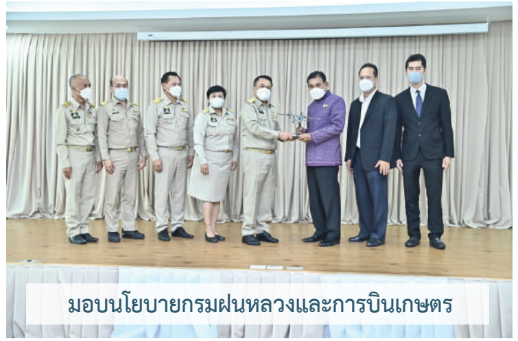
มอบนโยบายกรมฝนหลวงและการบินเกษตร

สำหรับกรมฝนหลวงและการบินเกษตร ถือเป็นหน่วยงานที่สำคัญในการเพิ่มปริมาณน้ำจากการกิจปฏิบัติการฝนหลวง จึงได้มีนโยบาย/งานสำคัญ 8 ด้าน ที่กรมฝนหลวงและการบินเกษตรต้องขับเคลื่อน ได้แก่ 1. การต่อยอดตำราฝนหลวงพระราชทาน โดยการกำหนดยุทธศาสตร์เป้าหมายงานวิจัย เพิ่มศักยภาพงานวิจัย เพื่อการพัฒนาต่อยอดวิธีการหรือเทคนิคทำฝนให้มีประสิทธิภาพมากยิ่งขึ้น เช่น การวิจัยเพื่อเพิ่มสูตรหรือปรับสูตรสารฝนหลวง การวิจัยปรับวิธีการทำฝนหรือตัดแปรสภาพอากาศ รวมถึงการศึกษาวิจัยเพื่อนำไปใช้ในกระบวนการงานสนับสนุน เช่น วิจัยเพื่อลดการใช้กำลังคนในการบินโปรย เป็นต้น 2. การปฏิบัติการฝนหลวงหรือการทำฝนหลวงให้ประชาชนเห็นผลแบบประทับใจ โดยการระดมทรัพยากรทำฝนในพื้นที่เป้าหมายให้เพียงพอในเชิงปริมาณน้ำให้มีความชุ่มชื้นเพียงพอภายในระยะเวลาอันสั้น เพื่อที่จะย้ายไปดำเนินการพื้นที่เป้าหมายอื่นในแบบเดียวกัน 3. นำเทคโนโลยีสมัยใหม่ที่มีประสิทธิภาพมาใช้เป็นเครื่องมือในการปฏิบัติงาน 4. ควรมีการปรับวิธีการจัดเก็บสารฝนหลวงให้คงสภาพคงคุณสมบัติได้นานที่สุด เพื่อประสิทธิภาพในการใช้งาน 5. การใช้เครื่องบินให้เกิดประโยชน์และคุ้มค่ามากที่สุด