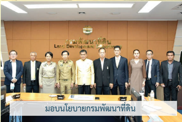
มอบนโยบายกรมพัฒนาที่ดิน

ในส่วนของกรมพัฒนาที่ดิน เป็นหน่วยงานที่สำคัญในการจัดการทรัพยากรดินที่เป็นพื้นฐานสำคัญ มีภารกิจในการสำรวจ วิเคราะห์จำแนกดิน การวางแผนการใช้ที่ดิน ทั้งพัฒนางานวิจัยเพื่อสร้างเทคโนโลยีและนวัตกรรมการจัดการดินที่เหมาะสมกับสภาพพื้นที่พัฒนาข้อมูล เพื่อบริหารจัดการทรัพยากรที่ดินรวมทั้งถ่ายทอดเทคโนโลยีอนุรักษ์ดินและน้ำ และปรับปรุงบำรุงดินเพื่อรักษาความสมดุลความเสื่อมโทรมของที่ดินและนิเวศเกษตร ซึ่งได้มอบนโยบายเร่งรัดการดำเนินงานโครงการอันเนื่องมาจากพระราชดำริ การอนุรักษ์ดินและน้ำ รวมทั้งการขยายจำนวนหมอดินอาสา และการให้ค่าตอบแทนหมอดินอาสาอย่างเหมาะสม