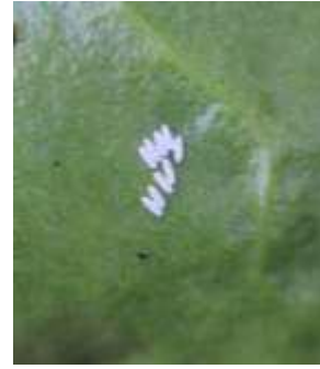
ตัวเต็มวัยแมลงวันหนอนขอนใบ ระยะหนอนแมลงวันหนอนขอนใบ ไข่แมลงวันหนอนขอนใบ