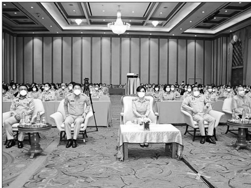
แก้หนี้ : น.ส.มัญญา ไทยเศรษฐ์ รัฐมนตรีช่วยว่าการกระทรวงเกษตรและสหกรณ์ ประชุมเชิงปฏิบัติการฯ เพื่อแก้ไขปัญหาทุจริตระบบสหกรณ์ และตั้งศูนย์ปฏิบัติการแก้ไขปัญหาการทุจริตสหกรณ์เกษตรและสหกรณ์ออมทรัพย์ 1.8 หมื่นล้านบาท

ด้านนายวิศิษฐ์ เปิดเผยว่า ให้ความสำคัญต่อการป้องกันความเสียหายที่จะเกิดขึ้นกับสหกรณ์ออมทรัพย์เป็นพิเศษ เนื่องจากสหกรณ์ออมทรัพย์ในประเทศไทย ปัจจุบันมีกว่า 1,400 แห่ง ทุนดำเนินงานกว่า 2.74 ล้านล้านบาท โดยกรมฯ สั่งการให้กรมส่งเสริมสหกรณ์ ส่งเจ้าหน้าที่เข้าไปติดตามดูแลระบบการเงินของสหกรณ์อย่างใกล้ชิด พร้อมทั้งหาแนวทางป้องกันปัญหาไม่ให้เกิดทุจริตซ้ำ จึงกำชับคณะกรรมการสหกรณ์วางระบบการตรวจสอบการทำงานของเจ้าหน้าที่สหกรณ์ออมทรัพย์ให้เป็นไปตามระเบียบของนายทะเบียนสหกรณ์ และข้อบังคับแต่ละสหกรณ์อย่างเคร่งครัด เพื่อรักษาผลประโยชน์สมาชิก