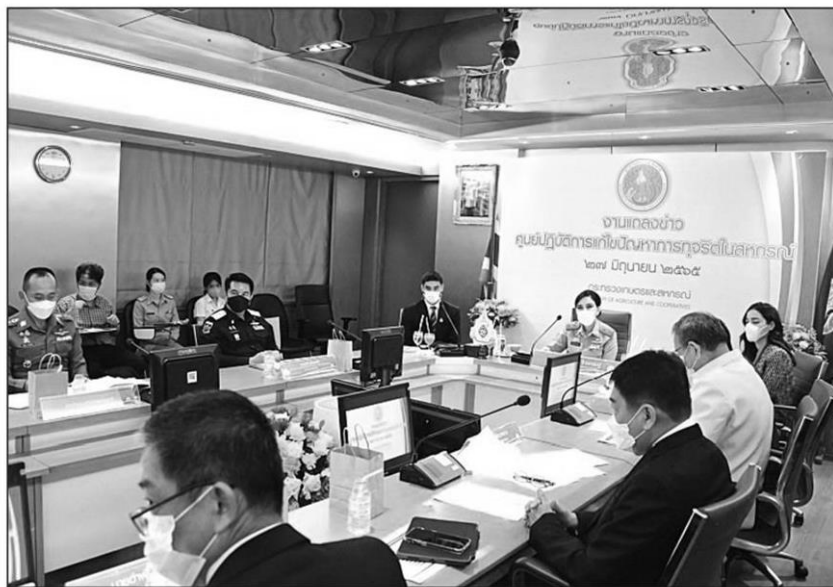
แก้ปัญหา : น.ส.มัญญา ไทยเศรษฐ์ รัฐมนตรีและสหกรณ์ เปิดศูนย์ฯ และร่วมประชุม แก้ปัญหาทุจริตสหกรณ์ออมทรัพย์กระทรวงเกษตรฯ โดยร่วมกับหน่วยงานต่างๆ วาง แนวทางเป็นโมเดลในการแก้ปัญหา

ใช้เป็นแนวปฏิบัติเดียวกัน เพื่อให้การขับเคลื่อน สามารถเดินทางได้อย่างรวดเร็ว ดังนั้น จะประสาน กับกรมสอบสวนคดีพิเศษ (ดีเอสไอ) และ ปปง. ร่วมวางแผนทางเป็นโมเดลแก้ปัญหาการทุจริตในสหกรณ์