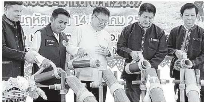
รมรณรงค์ทำปุ๋ย ร.อ.ธรรมนัส พรหมเผ่า รมว.เกษตรและสหกรณ์ ตรวจติดตามโครงการรณรงค์การทำปุ๋ยหมักจากซังข้าวโพดและเศษพืช เพื่อ ปรับปรุงบำรุงดินและลดปัญหาหมอกควันและ PM2.5 ที่บ้านต่อเรือ ต.ช่างเคิ่ง อ.แม่แจ่ม โดย ชัชวาลย์ ปัญญา รอง ผวจ.เชียงใหม่ ต้อนรับ.