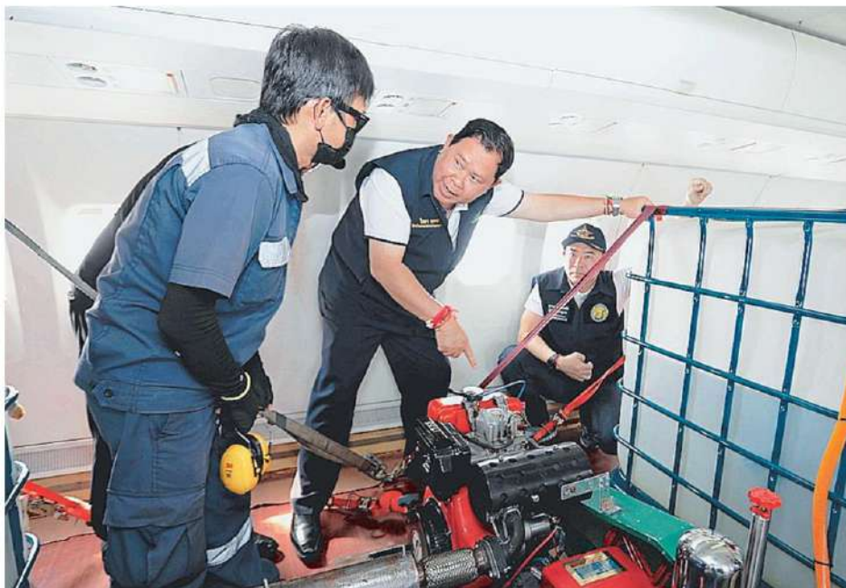
ใช้ฝนแก้ฝุ่น นายไชยา พรหมา รมช.เกษตรฯ ตรวจสอบอุปกรณ์บนเครื่องบินที่จะใช้ในการทำฝนหลวงเพื่อโปรยน้ำใส่ฝุ่นควันและช่วยดับไฟป่าในพื้นที่ภาคเหนือแก้ปัญหาฝุ่น PM 2.5 ที่อยู่ในระดับเริ่มส่งผลกระทบต่อสุขภาพ (ระดับสีส้ม)

ทั้งนี้ กรมฝนหลวงและการบินเกษตรจัดตั้งหน่วยปฏิบัติการฝนหลวงรวมจำนวน 5 หน่วยปฏิบัติการ ได้แก่ หน่วยปฏิบัติการฝนหลวง จ.เชียงใหม่ แพร่ จันทบุรี กาญจนบุรี และสงขลา ระหว่างวันที่ 8 มี.ค.-16 มี.ค. ใช้เทคนิคจัดแปรสภาพอากาศจำนวน 5 วัน 148 เที่ยวบิน ช่วยเหลือ 15 จังหวัดภาคเหนือ ส่งผลให้ค่าฝุ่นละอองขนาดเล็กมีแนวโน้มลดลงจากข้อมูลตรวจวัดฝุ่นละอองในอากาศโดยเครื่องบิน Super King Air การใช้เทคนิคการลดอุณหภูมิชั้นบรรยากาศผกผัน ช่วยระบายฝุ่นละอองที่มีขนาดเล็กกว่า 5 ไมครอนได้ประมาณ 40-50% เมื่อเปรียบเทียบกับพื้นที่ที่ไม่ได้ปฏิบัติการ