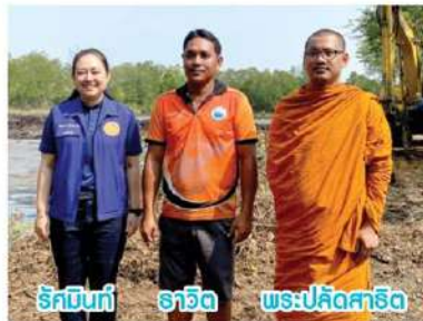
รัตนาภรณ์ ราชิด พระปลัดสาธิต