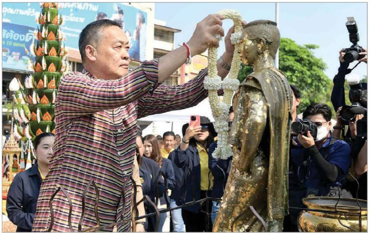
ให้ยาโม - นายเศรษฐา ทวีสิน นายกรัฐมนตรี สักการะอนุสาวรีย์ท้าวสุรนารี ก่อนลงพื้นที่ตรวจราชการ จ.นครราชสีมาโดยได้ไปตรวจเยี่ยมพื้นที่จัดงานมหกรรมพีชสวนโลก นครราชสีมา 2572 (Korat Expo 2029) ที่โคกหนองวังทศ ต.เทพาลัย อ.คง จ.นครราชสีมา ด้วย