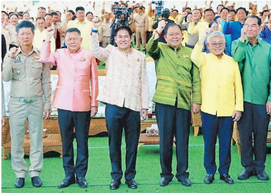
▲ มอบโฉมด ร.อ.ธรรมนัส พรหมเผ่า รว.เกษตรและสหกรณ์ นำคณะผู้บริหารกระทรวง เปิดพิธีคิกออฟมอบโฉมดเพื่อการเกษตรให้เกษตรกร ที่ศูนย์ส่งเสริมและพัฒนาอาชีพเสริมนอกภาคการเกษตร อ.บางไทร จ.พระนครศรีอยุธยา.