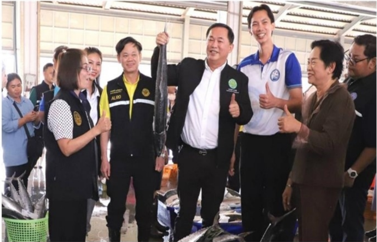
22 ม.ค. 2567 16:01 น.