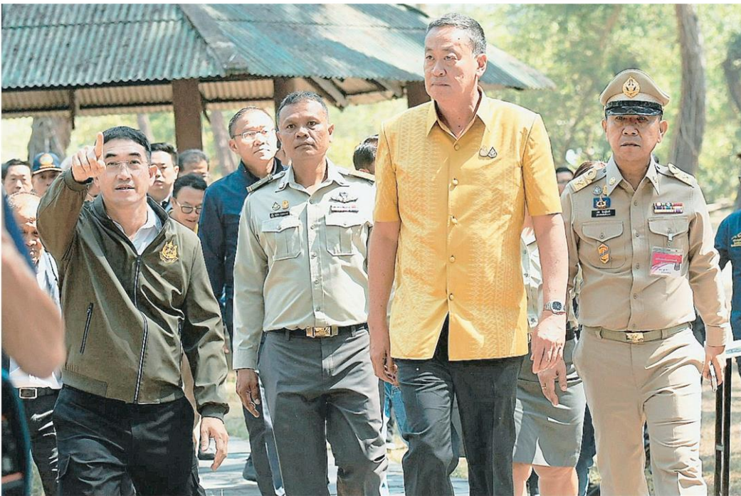
ดูพื้นที่จริง นายเศรษฐา ทวีสิน นายกฯ และ รมว.คลัง นำคณะรัฐมนตรี และผู้เกี่ยวข้อง ไปลงพื้นที่อุทยานแห่ง ชาติแหลมสน ต.ม่วงกลวง อ.กะเปอร์ เพื่อดูพื้นที่จริงที่จะก่อสร้างโครงการ สะพานเศรษฐกิจเชื่อมฝั่งทะเล อ่าวไทย- อันดามัน (แลนด์บริดจ์) โดยได้ผู้รับทำเรือ แหลมอ่าวอ่าง ต.ราชกรูด อ.เมืองระนอง ยืนยันพร้อมรับฟังทุกฝ่าย.