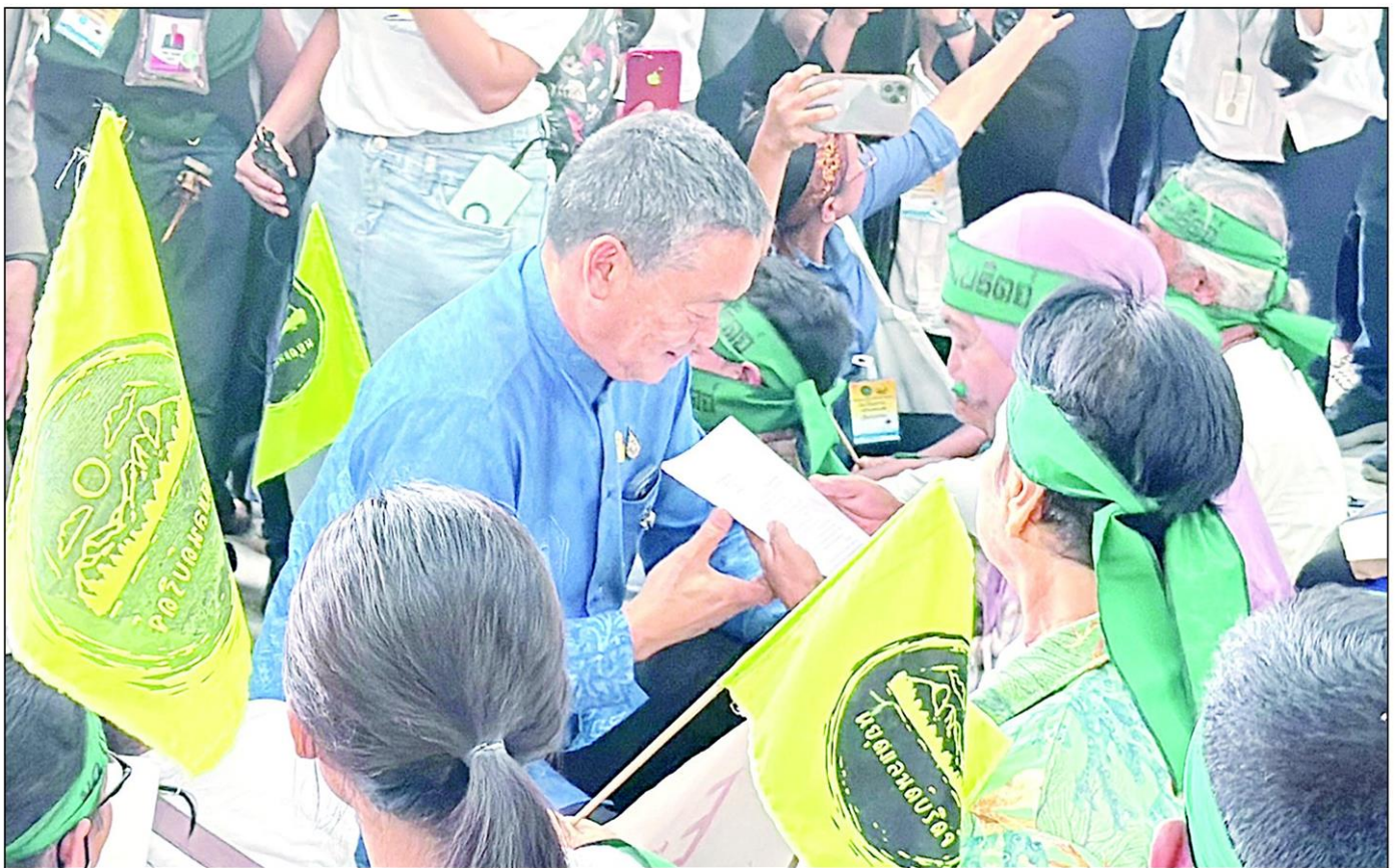
นายเศรษฐา ทวีสิน นายกรัฐมนตรีและ รมว.การคลัง ได้พบปะพูดคุยกับกลุ่มภาคประชาชนประมาณ 100 คน ที่เดินทางมาเยือนหนังสือคัดค้านการก่อสร้างโครงการ แลนด์บริดจ์ ที่มหาวิทยาลัยราชภัฏสวนสุนันทา ศูนย์การศึกษา จ.ระนอง

จากนั้นนายกฯ ถ่ายภาพร่วมกับ กรม. อ่านต่อหน้า 15