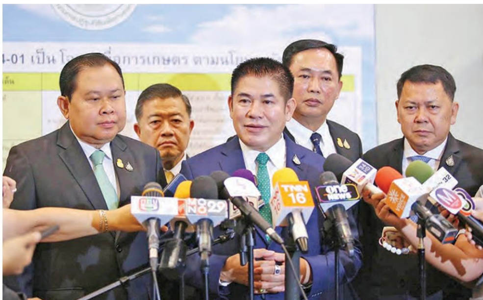
ร.อ.ธรรมนัส พรหมเผ่า รว. เกษตรและสหกรณ์