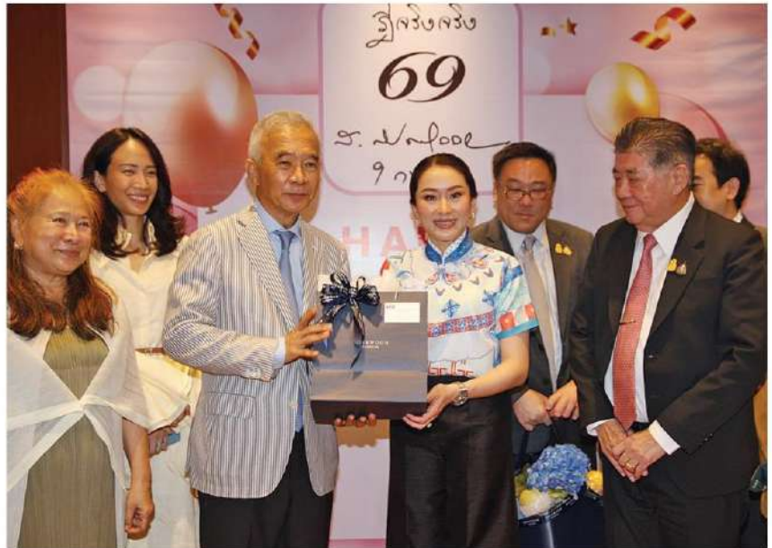
เบิร์ตเคย์ - น.ส.แพทองธาร ชินวัตร หัวหน้าพรรคเพื่อไทย พร้อมด้วย นายภูมิธรรม เวชยชัย รองนายกฯ และรวม.พาณิชย์ อวยพรวันเกิดครบ 69 ปี นายสุวัจน์ ลิปตพัลลภ ประธานพรรคชาติพัฒนาเก่า ที่บ้านพักเขตดุสิต กทม. เมื่อวันที่ 9 ก.พ.

นายเศรษฐาให้สัมภาษณ์ว่า จ.ลพบุรี เป็นครั้งแรกที่มาตอนหาเสียง แต่ไม่ได้มา.ชัยบาดาล ครั้งแรกมาดูเรื่องเขื่อนเรื่องน้ำท่วม ตกใจเหมือนกัน ว่าน้ำท่วมสูงเยอะ ฉะนั้นการทำเขื่อนการบริหารจัดการเรื่องน้ำวันที่ 12 ก.พ.นี้จะให้สส.เข้าไปพูด