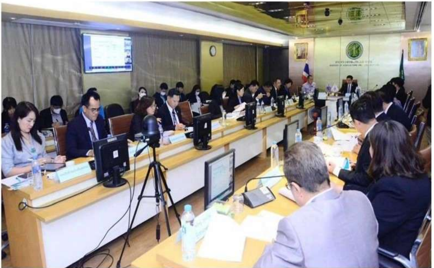
17 ก.พ. 2567 10:24 น.

ข่าว วิดีโอ หนังสือพิมพ์ ไทยรัฐทีวี โฟกัสสไตล์ กีฬา บันเทิง ดวง หอย นิยาย ซิปป์