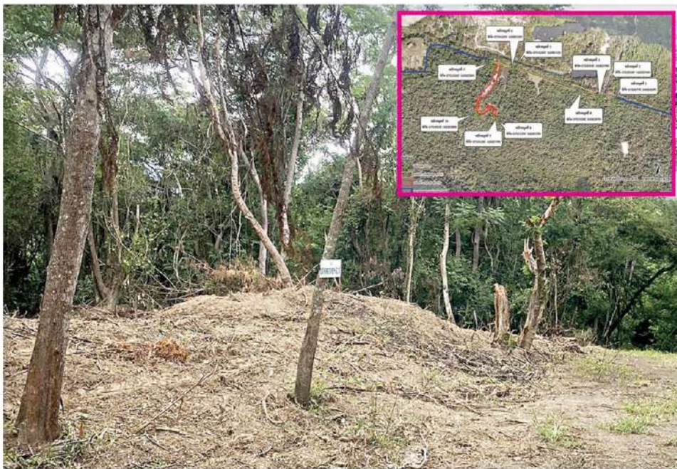
▲ งามป่า...ป่ามรดกโลกในอุทยานแห่งชาติเขาใหญ่ จ.นครราชสีมา ที่ถูกกลุ่มนายทุนบุกรุกแผ้วถางและปักหมุด ส.ป.ก. จนแว่แห้ว (ภาพเล็ก) ธรรมชาติเสียหาย โดยอธิบดีกรมอุทยานฯ เตรียมลงพื้นที่พิสูจน์