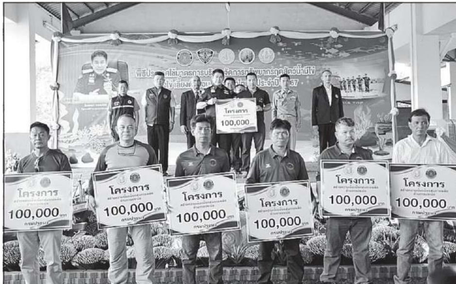
ปิดอ่าวไทย: ร.อ.ธรรมนัส พรหมเผ่า รว.เกษตรและสหกรณ์เป็นประธานใน "พิธีประกาศใช้มาตรการบริหารจัดการทรัพยากรสัตว์น้ำมีไข่ วางไข่ เลี้ยงตัวอ่อน พื้นที่ทะเลอ่าวไทย ประจำปี 2567" พร้อมมอบแผ่นป้ายเงินอุดหนุนโครงการพัฒนาอาชีพและส่งเสริมความเข้มแข็งของชุมชนประมง ให้ประธานองค์กรชุมชนประมงท้องถิ่น 9 ชุมชนในเขตชุมชนประมงสุราษฎร์ธานีและประจวบคีรีขันธ์ ณ ท่าเทียบเรือประมงชุมพร.