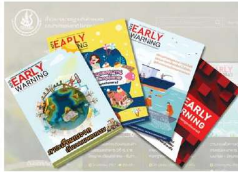
วารสารเพื่อการเตือนภัยสินค้าเกษตรและอาหาร

อาหาร คือ มาตรการจากกฎระเบียบทางเทคนิคในส่วนที่ไม่ใช่ SPS ซึ่งกำหนดเกี่ยวกับลักษณะของสินค้า กระบวนการผลิตสินค้า รวมถึงเรื่อง ฉลาก สัญลักษณ์ เครื่องหมาย คำศัพท์ นอกจากนี้ยังครอบคลุมกระบวนการประเมินความสอดคล้อง ที่ใช้ประเมินว่ามี การปฏิบัติ ตามข้อกำหนดที่