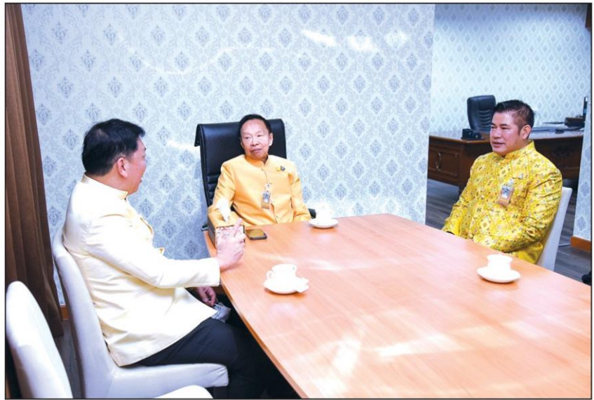
▲ แก้ปัญหาส.ป.ก. : ร.อ.ธรรมนัส พรหมเผ่า รมว.เกษตรและสหกรณ์ ร่วมหารือกับ พล.ต.อ.พัชรวาท วงษ์สุวรรณ รองนายกฯ และรมว.ทรัพยากรธรรมชาติและสิ่งแวดล้อม กรณีปัญหาหมุดนิรนาม ส.ป.ก.4-01ในเขตอุทยานแห่งชาติเขาใหญ่ โดยได้ข้อสรุปว่า พื้นที่รอยต่อติดกรมอุทยานฯไม่ควรจัดสรรให้ประชาชน

อย่างไรก็ตาม การให้มาช่วยราชการที่ ส.ป.ก. ส่วนกลาง ไม่ใช่การแต่งตั้งหรือการย้าย แต่เพื่อให้เกิดความโปร่งใสในการตรวจสอบข้อเท็จจริง โดยได้แต่งตั้งรักษาราชการแทนปฏิรูปที่ดินจังหวัดนครราชสีมาแล้ว หากผลการตรวจสอบข้อเท็จจริงปรากฏว่าเจ้าหน้าที่ของส.ป.ก. กระทำผิดหรือบกพร่อง ต้องดำเนินการตามระเบียบและกฎหมาย แต่หากเป็นการปฏิบัติตามหน้าที่ต้องให้ความยุติธรรม