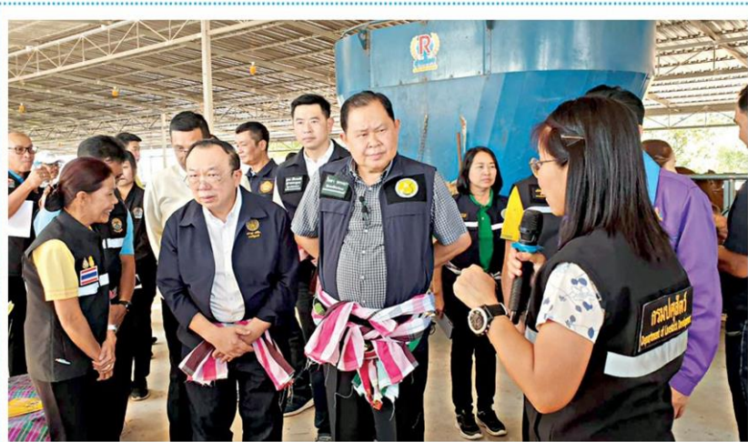
☑ ลงพื้นที่....นายไชยา พรหมา รมช.เกษตรและสหกรณ์ ลงพื้นที่ไปยัง วัดโกสุมใต้ ต.หัวขวาง อ.โกสุมพิสัย จ.มหาสารคาม พร้อมรับฟังปัญหาข้อร้องเรียนจากเกษตรกรในพื้นที่ จากนั้นได้ประชุมตรวจติดตามผลการดำเนินงานและการมอบนโยบายการขับเคลื่อนงานด้านการปศุสัตว์ของจังหวัดมหาสารคาม ณ สำนักงานปศุสัตว์จังหวัดมหาสารคาม