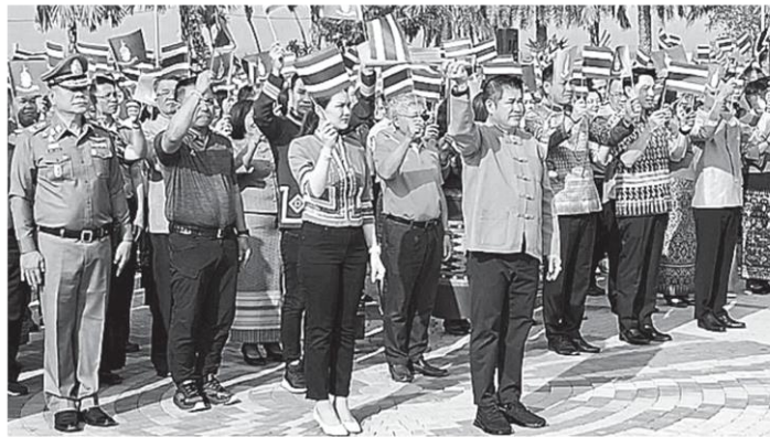
ถวายกำลังใจ ร.อ.ธรรมนัส พรหมเผ่า รวมเกษตรและสหกรณ์ ประธาน พร้อมด้วยหัวหน้าส่วนราชการและพสกนิกรทุกหมู่เหล่า ใส่เสื้อสีม่วงและสีเหลือง ถวายกำลังใจแก่ สมเด็จพระกนิษฐาธิราชเจ้า กรมสมเด็จพระเทพรัตนราชสุดาฯ สยามบรมราชกุมารี ณ ลานอนุสาวรีย์พ่อขุนงำเมือง อ.เมืองพะเยา.