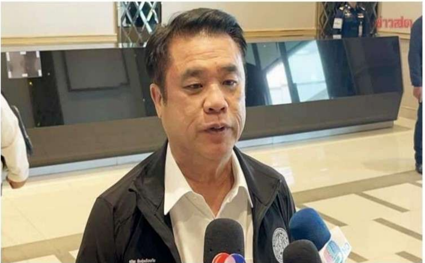
สุริยะ เร่งคุยเอกชน เคาะจำนวนปุ๋ยยูเรีย ก่อนเจรจารัสเซีย ยันราคาสูงก็ไม่ซื้อ