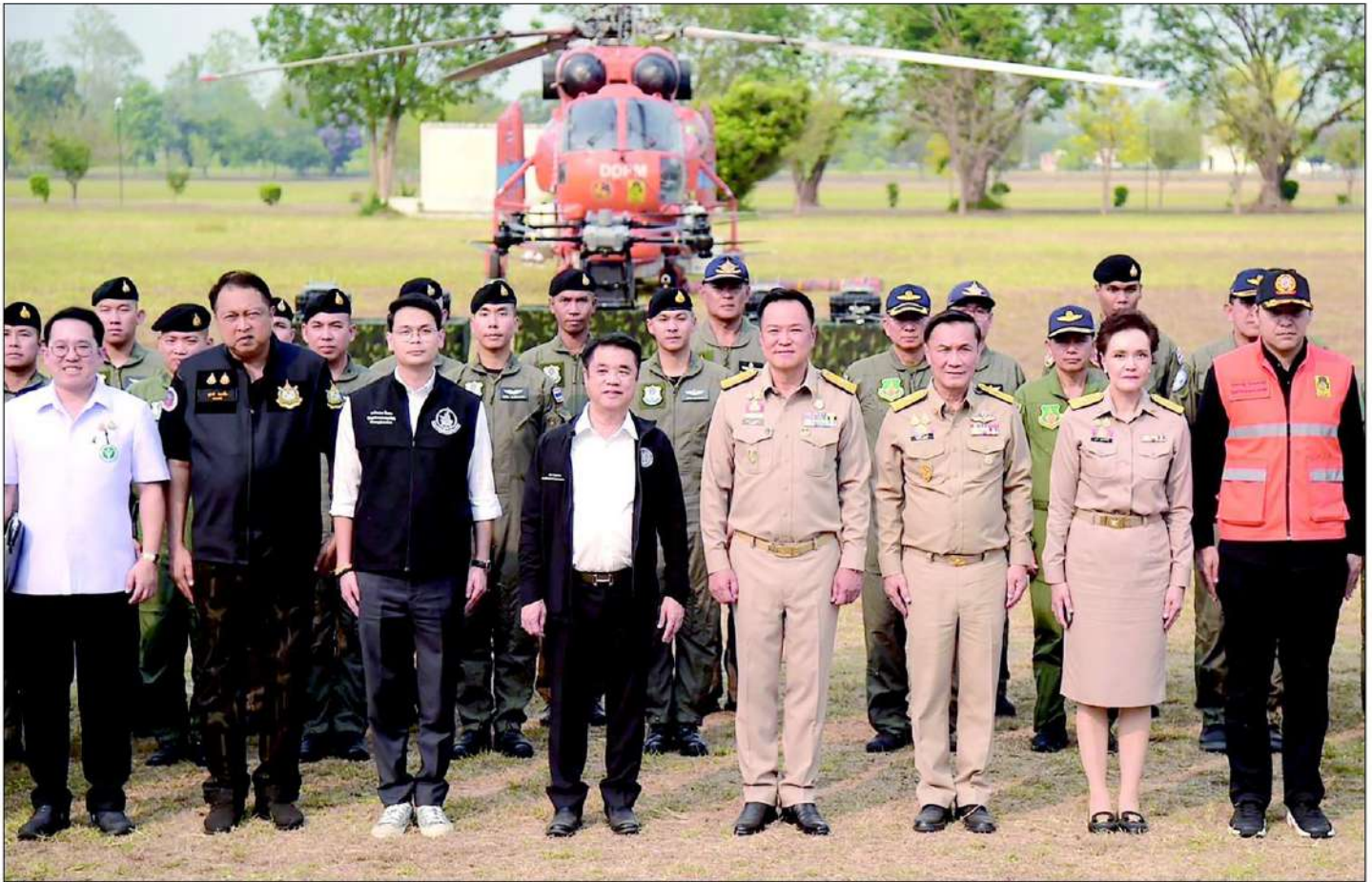
นายอนุทิน นายสุริยะ รองนายกรัฐมนตรีและ รววม.มหาดไทย ถ่ายภาพหมู่ระหว่างลงพื้นที่ตรวจติดตามภารกิจดับไฟป่า และติดตามความพร้อมของเฮลิคอปเตอร์ป้องกันและบรรเทาสาธารณภัย และทีมปฏิบัติการภาคสนาม ที่ฐานการบินกองพลทหารราบที่ 7 อ.แมริม จ.เชียงใหม่ เมื่อวันที่ 20 เม.ย.

"สภาปัญหาไฟป่าหมอกควัน ปลดปล่อยให้เป็นแบบนี้ต่อไปเรื่อยๆ ไม่ได้ เพราะสักวันหนึ่งความมั่นใจจะหายไป และจะมีแต่ความเร้นแค้นความลำบากในพื้นที่แห่งนี้ สิ่งนี้ยังพอแก้ไขได้เพราะเรามีสองประเด็นที่ทำได้ ขอให้ทำในสิ่งที่เรควบคุมได้ อะไรนอกเหนือความควบคุม